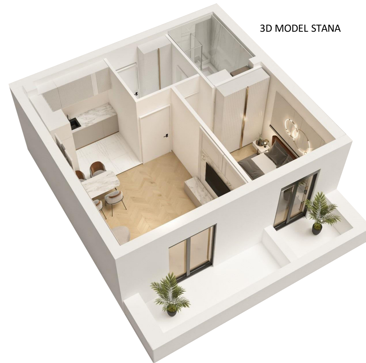
3D MODEL STANA